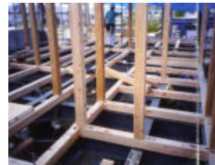
鉄骨架台と土台・柱

免震とは、建物が受ける地震による激しい揺れのエネルギーを、特殊な装置によって低減し、ゆっくり揺らすことにより、地震の被害を軽減する構法です。免震住宅は、人の命を守り、財産(建物・家具・電化製品など)を守り、災害後も自宅で生活することが可能です。