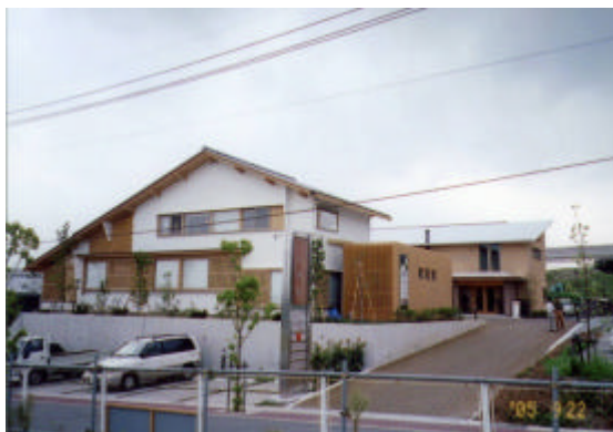
彩都・暮らしのギャラリー「木想館」