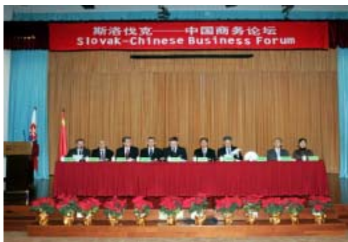
調印直後開催のビジネスフォーラムの様子