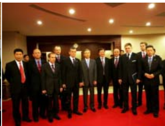
調印後の記念写真